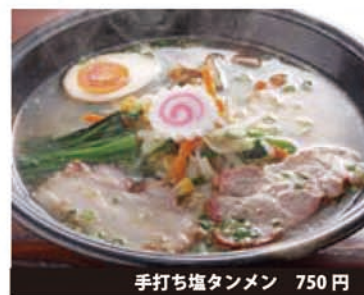
手打ち塩タンメン 750 円