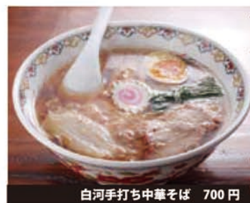
白河手打ち中華そば 700 円

とら食堂の弟子「活カ屋」で修行した若主人。白河中華の流れを大事にしながら、独自のこだわりで、うまさ追求している。食材には徹底してこだわりを持っていて、名古屋コーチンの丸鶏や長崎産の焼干し、利尻昆布や羅臼昆布を使用するという徹底ぶり。化学調味料を使用しないから体にも優しいラーメンですね。 見た目はほぼ同じですが、手打ち中華(和風だし)は、カツオや煮干しのダシがしっかりと効いた別物です。好みは分かれるかもしれませんが、ぜひ食べてほしいですね。お店の人気ナンバーワンの「塩タンメン」は野菜たっぷり。さまざま野菜の甘み加わるとスープのコクが増しています。