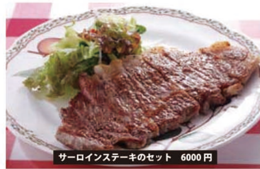
サーロインステーキのセット 6000 円

聞けば、もとは飯館村にあった飯館牛専門のステーキ店だったとか。10月6日に相馬市に再オープンしました。扱肉は、全国各地の選りすぐりの和牛。A5ランクのサーロインステーキ(200g)は、口に入れた瞬間にとろけるよう。脂はしつこいどころか、甘みを感じます。一見高い値段に思われますが、同程度のステーキなら東京都内なら3倍近いお値段ですから、かなりお得です。カジジュアルにピッツアやパスタも楽しめます。この店のオーナーは、フレンチのシェフと